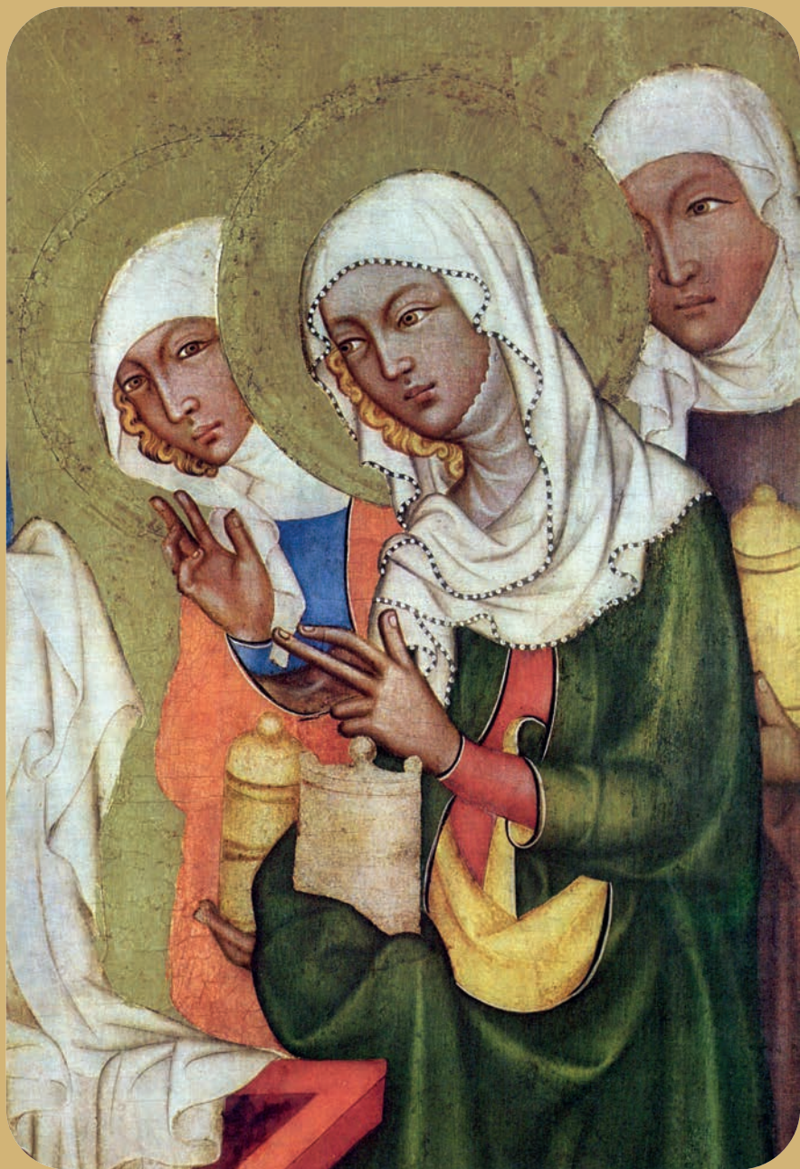
Meister von Hohenfurth, De drie Maria's bij het graf (detail).